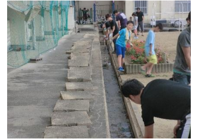
親子労力奉仕活動