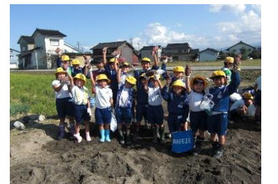
サツマイモの収穫